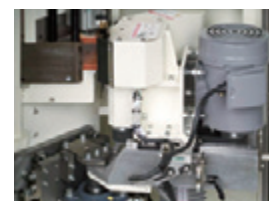
加工部 Cutter unit